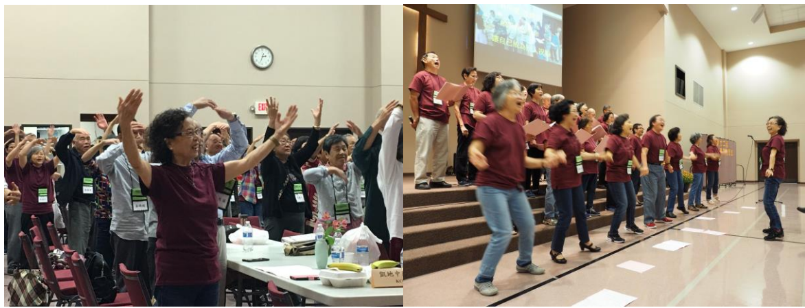
2018 金色年华：同心敬拜天上的父