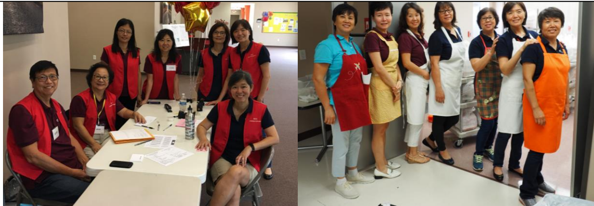
KCCC 同工，在主里同心服事分享喜乐