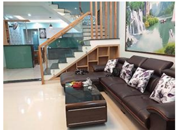
Our new home for the next few months as we settle into Vietnam — Grandma's home

I have a lot of hope and dreams of what the first six months will look like. But, at the